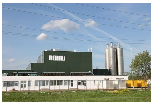
Завод немецкой компании «REHAU», выпускающей оконные профили, начал свою работу в п. Гжель Раменского района в мае 2005 г.

Сегодня в области действует свыше 60 производств зарубежных компаний, еще несколько проектов находятся на стадии проекта или строительства.