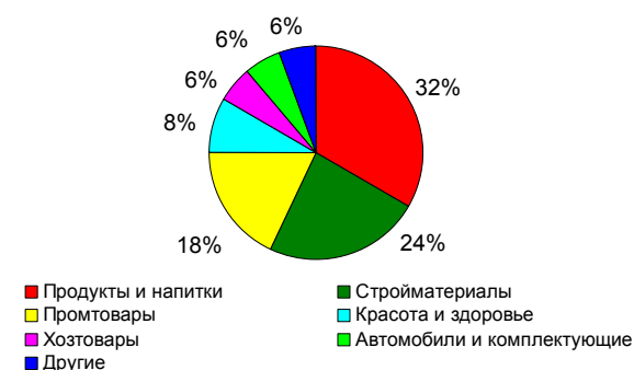
Диаграмма 1. Профили производств в Московской области*

Исторически большая часть производств в Московской области (см. диаграмму) формируется компаниями, производящими продукты (в первую очередь, молочные – Campina, Danone, Ehrmann – и кондитерские – Barry Callebaut, Masterfoods, Коркунов / Wrigley и др.) и напитки – как алкогольные (Sun-Interbrew) так и безалкогольные (PepsiCo, Нидан и др.). Немалую долю составляют также заводы, производящие стройматериалы и промтовары.